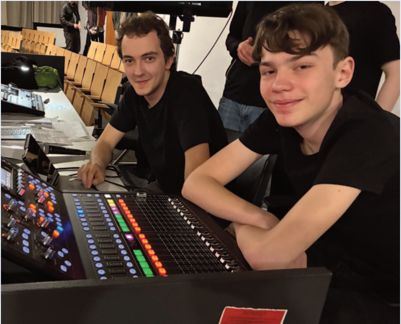
Einsatz in der gewohnten Umgebung: Am Mischpult in der Aula sind die Mitglieder des Technik-Teams der ESG am häufigsten aktiv, z.B. beim Theaterabend.