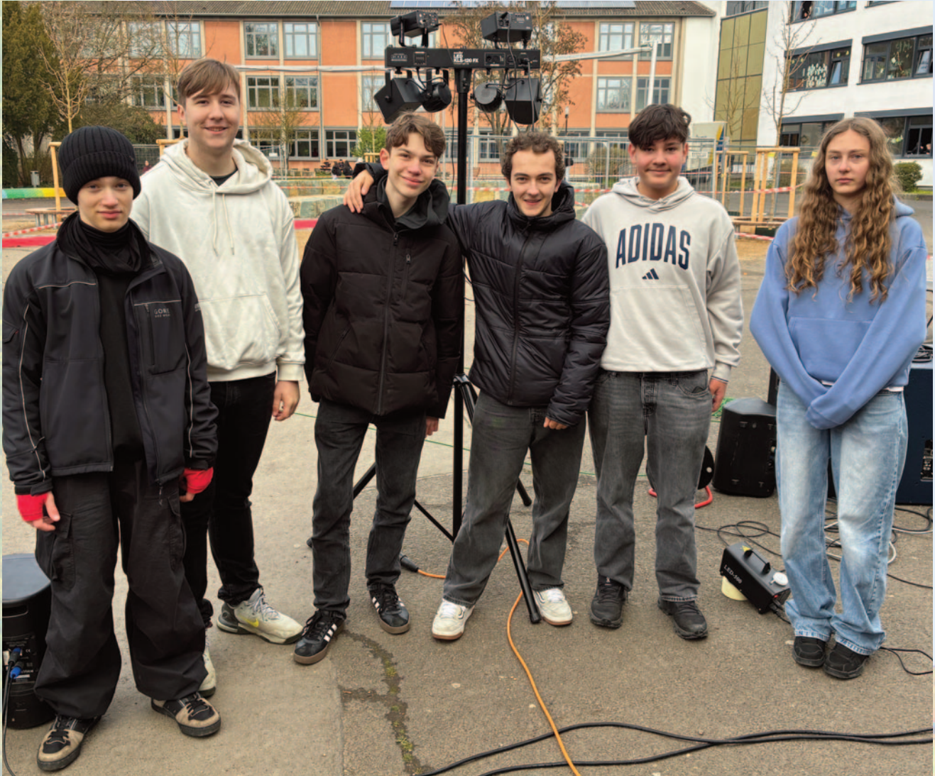
Einsatz auch unter freiem Himmel: Beim Abigag war das Technik-Team der ESG für den Ablauf mitverantwortlich. Nicht nur an der Aula drehen sie an den Knöpfen des Mischpults.

Ohne sie läuft in der Aula nichts. Das Technik-Team sorgt bei jeder Veranstaltung für Licht und Ton. Doch dabei kann auch ziemlich viel schiefgehen. Wir haben sie bei Proben begleitet.