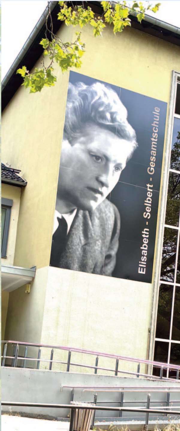
Ein Foto der Namenspatronin ziert die Fassade des Schulgebäudes.

fest überzeugt. Ihr war es immer wichtig, insbesondere jungen Frauen mitzugeben, für sich selbst sorgen zu können und niemals wirtschaftlich von einem Mann abhängig zu sein. Gleichzeitig hat sie jungen Männern die Bedeutung eines partnerschaftlichen Miteinanders vermittelt. Sie würde sich sicher freuen, weil ihr Lebenswerk dadurch weitergetragen wird und Schülerinnen und Schüler etwas über ihre